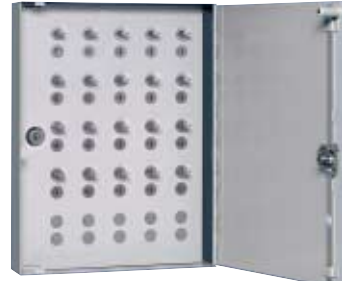
25 Paar Art. 17.004 Schrankmasse: H 550 x B 420 x T 90 mm

Gehäuse aus 2 mm Stahlblech geschweisst, Farbe kieselgrau. Die Schranktüre ist rechts gebandet und besitzt einen Bügelgriff zum Öffnen sowie eine Magnetzuhaltung (Art. 17.002/17.003/17.004). Auf Wunsch ist die Schranktüre verschliessbar (3-Punktverschlusszylinder). Falls die Zylinderbefestigungsplatte nicht komplett bestückt und die Schranktüre nicht abschliessbar sein soll, werden die Leerstellen mit Blindzapfen aufgefüllt.