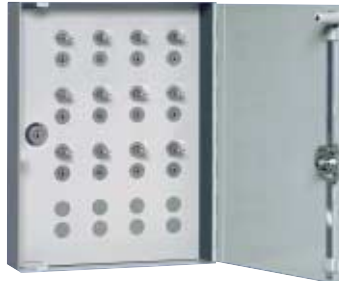
16 Paar Art. 17.003 Schrankmasse: H 450 x B 350 x T 90 mm