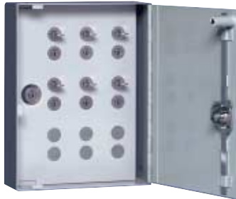
9 Paar Art. 17.002 Schrankmasse: H 350 x B 270 x T 90 mm